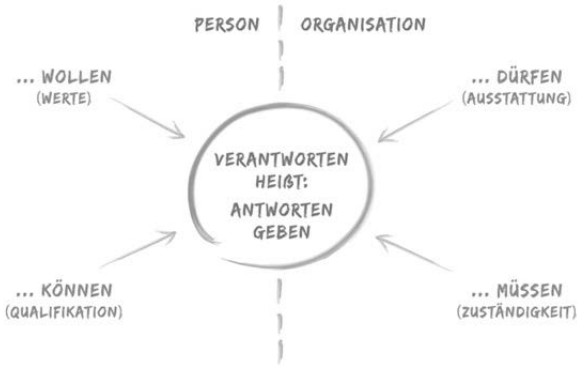
Vier Dimensionen eines Verantwortungssystems

Entstehen Grundfragen, etwa die nach der Steigerung der Effizienz, aber auch nach der Lebensqualität und Würdigung von Menschen in einer Organisation, müsste geklärt werden, wer sich bezogen darauf welche Art von Fragen stellen sollte, für Antworten zuständig ist bzw. an welcher Art von Antworten gemessen wird. Ich denke zum Beispiel an Ressourcen-Verantwortung in Führungsbeziehungen. Nehmen wir einen Chef, der immer wieder neue höchste Dringlichkeiten definiert. Die von gestern und vorgestern sind allerdings nicht abgearbeitet oder womöglich noch nicht einmal in Angriff genommen und die vom letzten Quartal, die mit großem Engagement, mit Geld- und Zeiteinsatz angegangen wurden, versanden einfach.