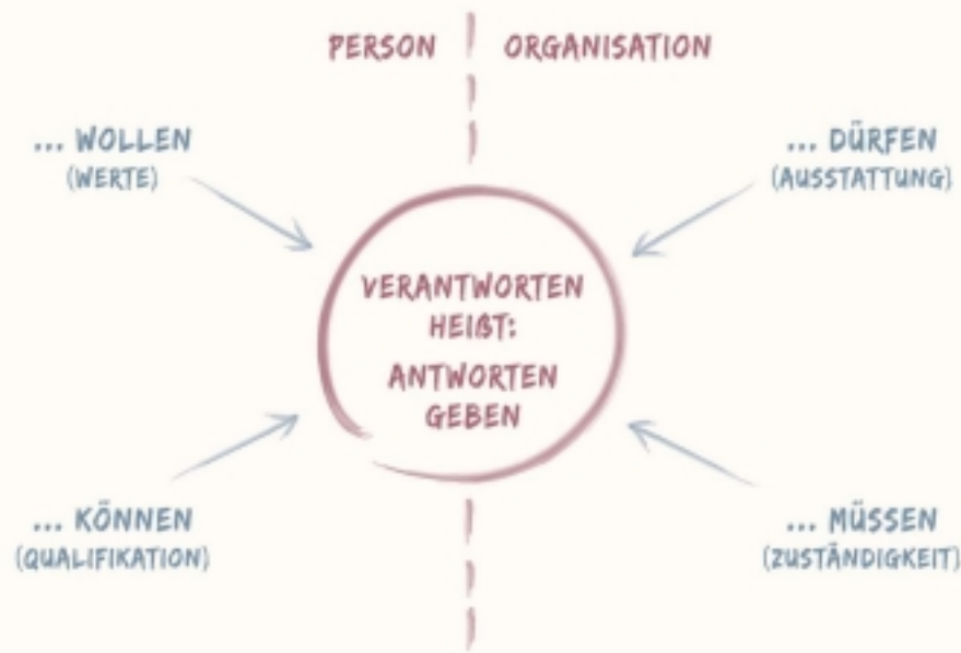
Vier Dimensionen eines Verantwortungssystems

Mit den Fragen und Antworten des Lebens umgehen, im Denken, im Erleben, in Begegnungen und in der Lebensweise - Das ist nicht immer leicht oder bequem, doch entscheidend für Würde, für Professionalität und für Menschlichkeit.