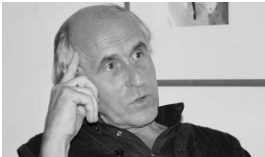
"Kultur vor Inhalt ist der Slogan der Zukunft."

bessern wollen, befinden wir uns in dieser Situation sich auflösender Selbstverständlichkeiten und gemeinsamer Kultur.